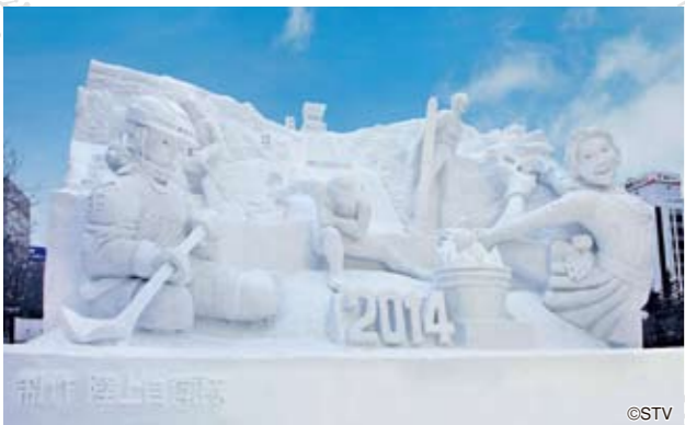
「ウィンタースポーツ天国、北海道!」"Winter Sports Paradise, Hokkaido!"

※掲載写真は2014年の様子です。※Photo is an image from the festival in 2014.