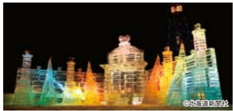
「ハートの宮殿」"Palace of the Heart"

さっぽろ雪まつりは第11旅団を基幹とする陸上自衛隊北部方面隊の協力を受けています。 The Northern Group of the Japan Self-Defense Force, and the 11th Brigade in particular, actively cooperates in the Sapporo Snow Festival.