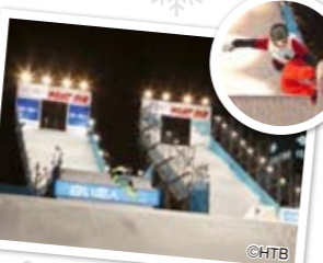
スノーボードジャンプ台 Snowboarding Jump Platform