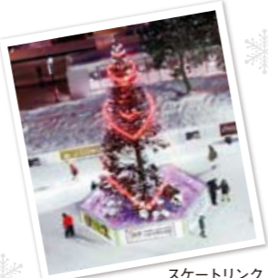
スケートリンク Skating Rink

さっぽろ雪まつりは第11旅団を基幹とする陸上自衛隊北部方面隊の協力を受けています。 The Northern Group of the Japan Self-Defense Force, and the 11th Brigade in particular, actively cooperates in the Sapporo Snow Festival.