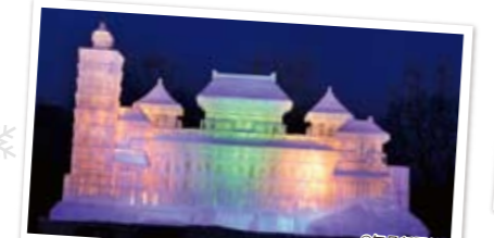
「台湾-伝統とモダン」 "Traditional and Modern Taiwan"