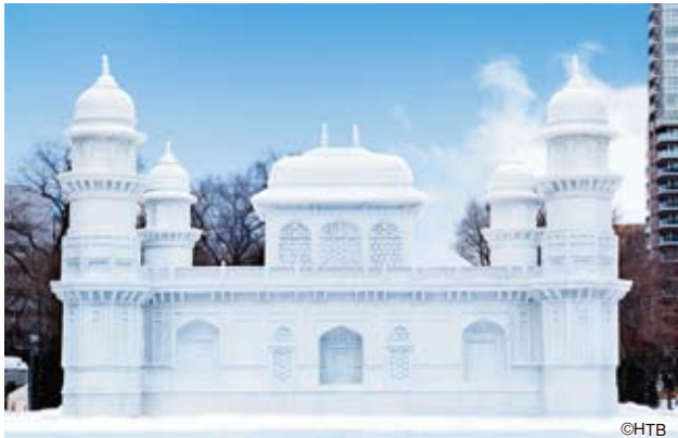
「イティマド・ウッダウラ(インド)」"TOMB OF ITMAD-UD-DAULA (India)"

Odori Park, which stretches about 1.5km east to west through the center of Sapporo, will be transformed into a fantasy world of snow and ice. All the works of art sculpted with pure white snow and sparkling clear ice will certainly deliver the sculptors' passion to the guests viewing them. And the wonderful harmony of grandness and delicacy makes them the biggest attraction of Sapporo Snow Festival.