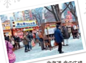
北海道 食の広場 Hokkaido Winter Food Park

オールシーズン魅力がいっぱい! ようこそ札幌へ Lots of attractions all year-round! Welcome to Sapporo!