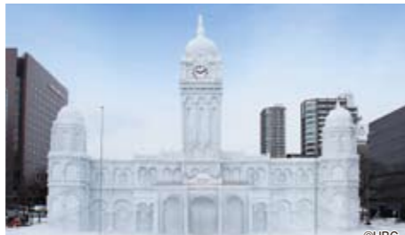
「スルタン・アブドゥル・サマド・ビル」"Sultan Abdul Samad Building"

※掲載写真は2014年の様子です。※Photo is an image from the festival in 2014.